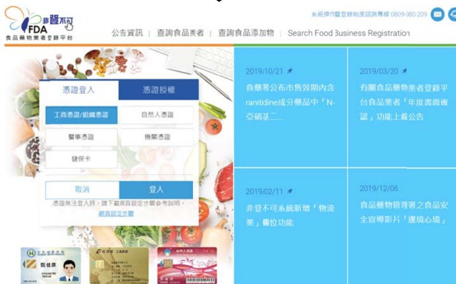
圖 3a. 食品業者以憑證方式登入「非登不可」系統。