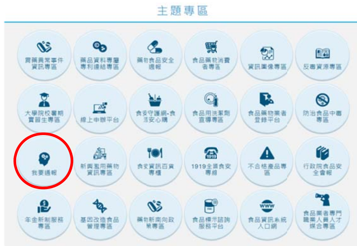
圖 1b. 食品業者進入食藥署官網下方主題專區，點選「我要通報」。