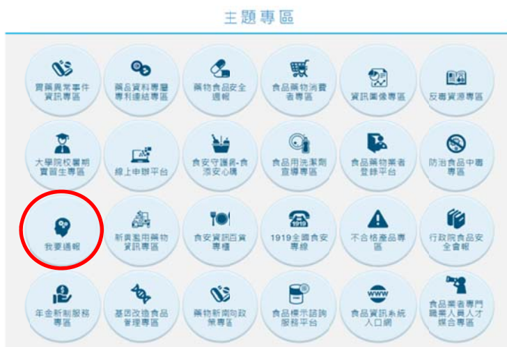
圖 1a. 食品業者進入食藥署官網下方主題專區，點選「我要通報」。